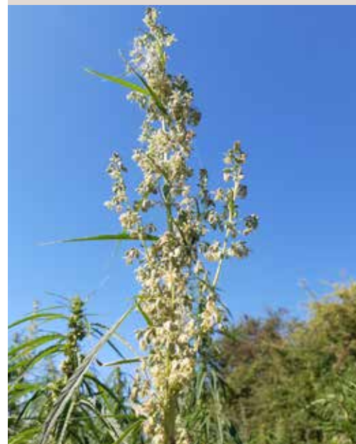
Die Firma Hanf Industries hat sich auf die Verarbeitung der Hanfsamen spezialisiert.