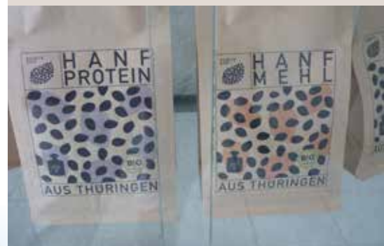
Die Produkte kommen unter der Marke Hainich Hanf in den Handel.