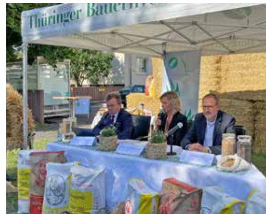
Erntepressekonferenz in Bad Langensalza

Zu dem vom Bundesministerium für Ernährung und Landwirtschaft (BMEL) vorgelegten Entwurf einer GAP-Ausnahmen-Verordnung für eine Aussetzung der Fruchtwechselverpflichtung (GLÖZ 7) und zusätzliche Anrechnungsmöglichkeiten bei den Stilllegungsvorgaben (GLÖZ 8) läuft inzwischen sowohl im Agrar als auch im Umweltausschuss ein schriftliches Umfrageverfahren. Kritische Punkte und Nachbesserungsbedarf hat der Deutsche Bauernverband (DBV) mit seinen Landesbauernverbänden erarbeitet und auf diese gegenüber BMEL und Ländern mehrfach hingewiesen. Dem Vernehmen nach sind unter den Ländern bestimmte Änderungsanträge im Gespräch. Die Verzögerungen und fehlende Klarheit für die Landwirtinnen und Landwirte sind aus Sicht der Bauernverbände außerordentlich kritisch zu bewerten.