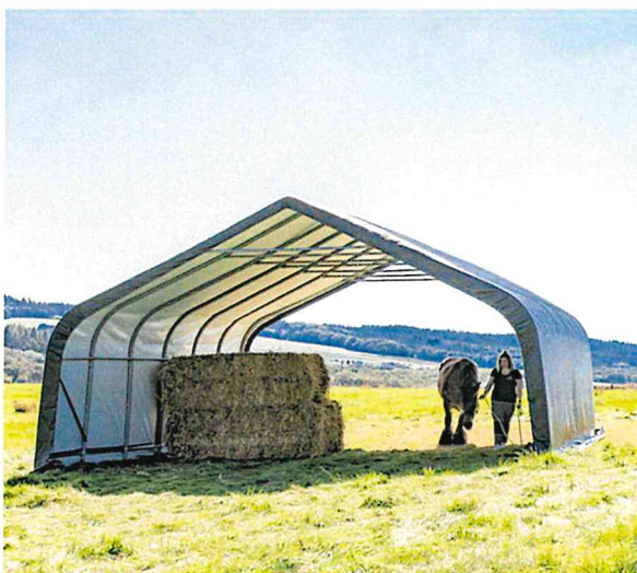
Bild 4: Mobiles Weidezelt für Tiere, Futter oder Technik