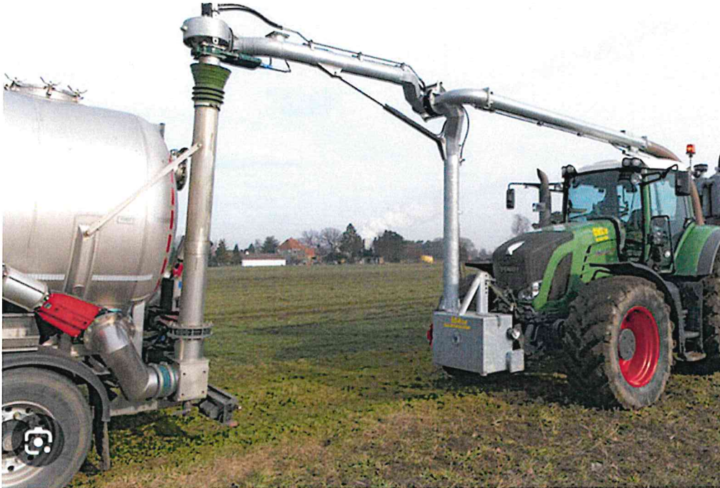
Bild 1: Verlustfreie Übergabe von Gülle aus einem Transportwagen zum Güllewagen mittels Saugleitung