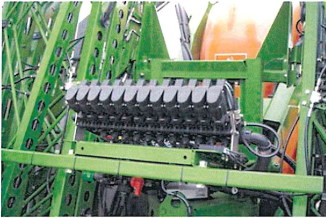
Bild 2: Elektromechanische Abschaltanlage an einer Pflanzenschutzspritze